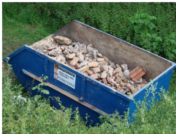
Die gesponserte Mulde von Habigtsberg