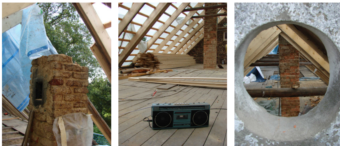
Musikzimmer mit Kamin(rest) – und das Ganze aus der Eulenperspektive

Zwischendurch kam eine neue Lieferung unseres Holz-Sponsors Holzland Brinkmann mit weiteren Dachlatten und Bodendielen. Und auch Imker Glitz schaute vorbei, brachte Honig und tränkte seine Bienen – auch die litten wohl etwas unter dem schwülen Wetter. Na besser schwül als nass – hoffentlich hält es bis Freitag, dann sollen die neuen Dachpfannen an ihren Platz!