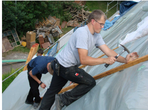
Kampf mit Windböen – Wie sagt der Chef? „Feierabend ist, wenn das Dach zu ist!“