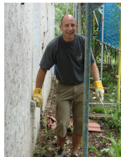
Fassadenputzer am Werk