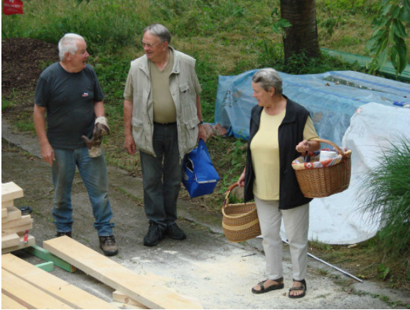
Mittagsimbiss körbeweise ...