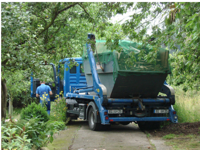
Altholz auf Reisen