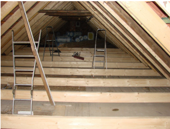
Fortschritte unterm Dach