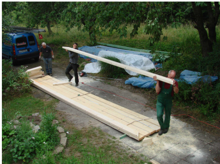
Die neuen Deckenplanken werden herbeigeschafft