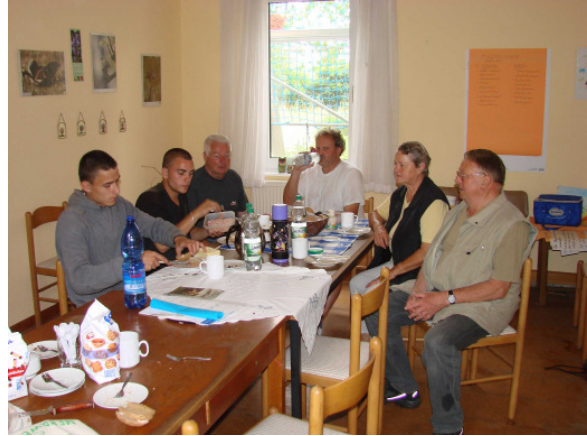
... und der Versuch, diese zu leeren