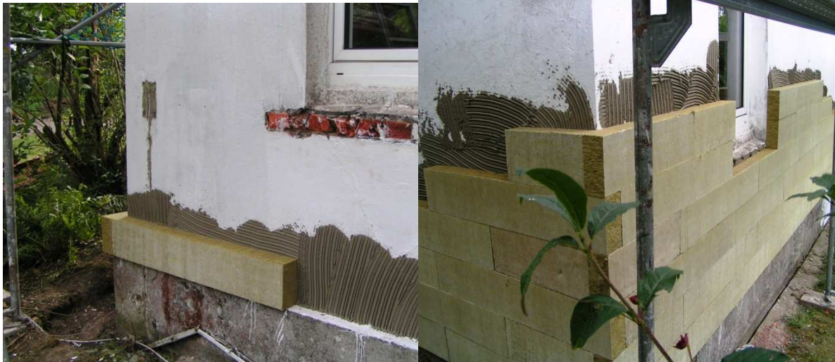
Die erste Dämmplatte und das Werk bis zur Frühstückspause