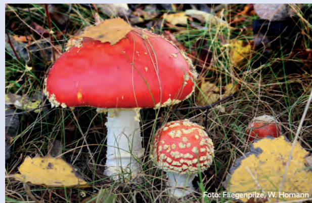
Foto: Fliegenpilze

Die genauen Termine finden Sie auf der NABU-Homepage unter Mitmachen | Kindergruppe.