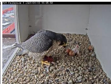
Das 1. Küken (10.4.21)