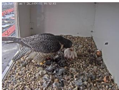
Zum Abendessen gibt's Buntspecht (13.4.)