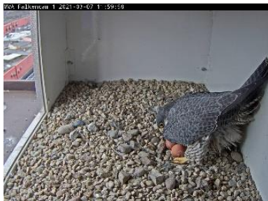
Das 2. Ei (7.3.21)