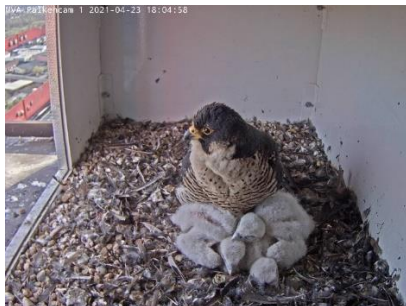
Die Decke wird zu kurz (23.4.21)