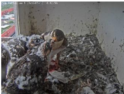
ca. 30 Tage alt (12.5.21)