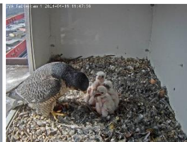
ca. 1 Woche alt (18.4.21)