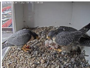
Der Terzel bringt Futter (15.4.21)