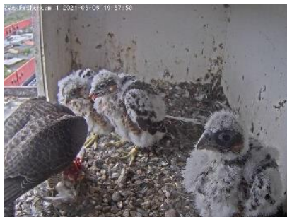
Federn sprießen (8.5.21)