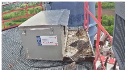
3 flügge Mädels (25.5.21)