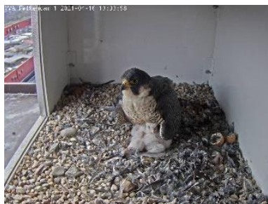
Mama hudert (16.4.21)