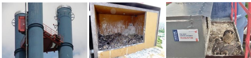
Drei Generationen von Nistkästen über der MVA Heepen.