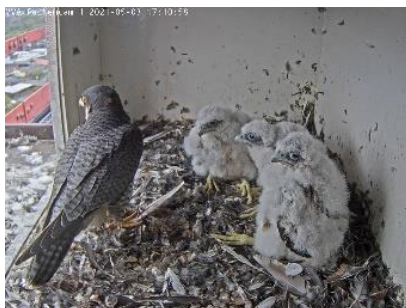
ca. 3 Wochen alt (3.5.21)