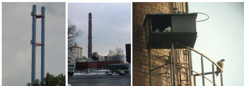
Die Brutplätze MVA (Heepen) und Stadtwerke (Schildesche); Nistkasten Stadtwerke.

Nachfolgend werden die bekannten Daten zu den Brutplätzen in der Stadt zusammengefasst und kurz kommentiert.