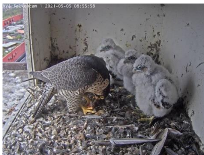
Immer schön der Reihe nach (5.5.21)