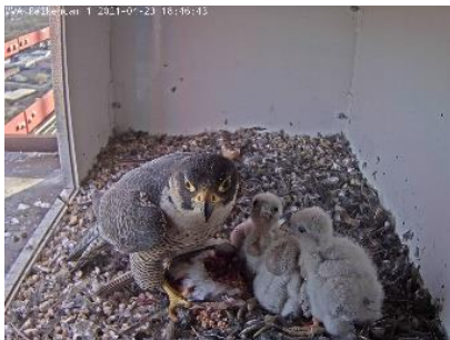
Volle Kröpfe (23.4.21)