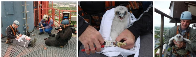
Beringung auf der MVA und bei den Stadtwerken

WEGENER, D. (2007): Wanderfalkenbrut in Bielefeld. – 12. Jahresheft des NABU Bielefeld, 40-41.